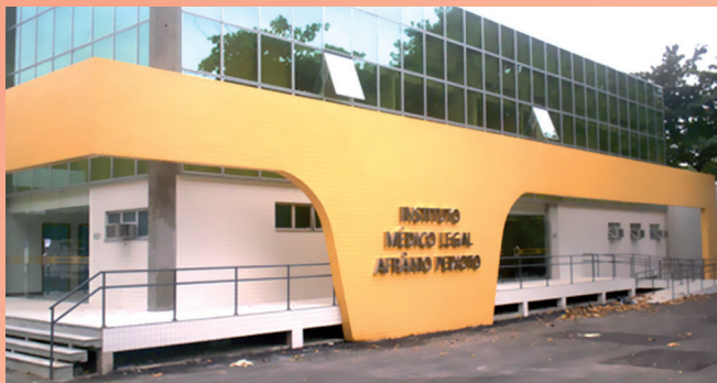
Prédio do IMLAP